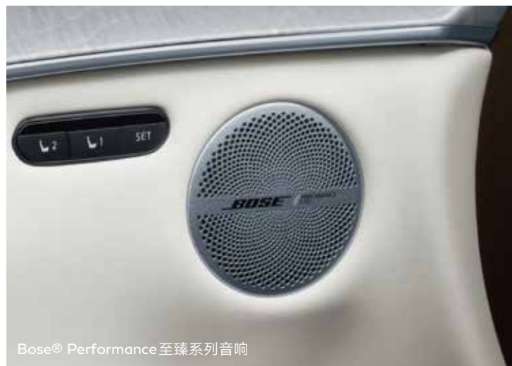
Bose® Performance 至臻系列音响