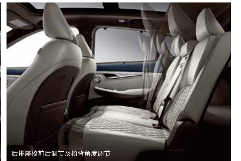
后排座椅前后调节及椅背角度调节