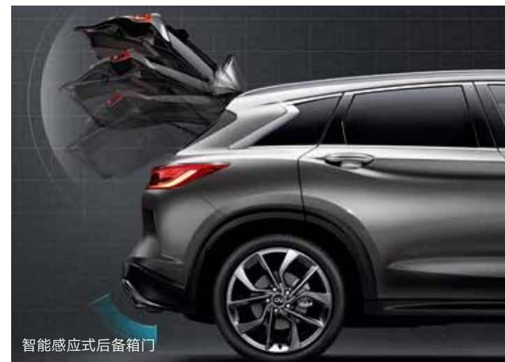
智能感应式后备箱门