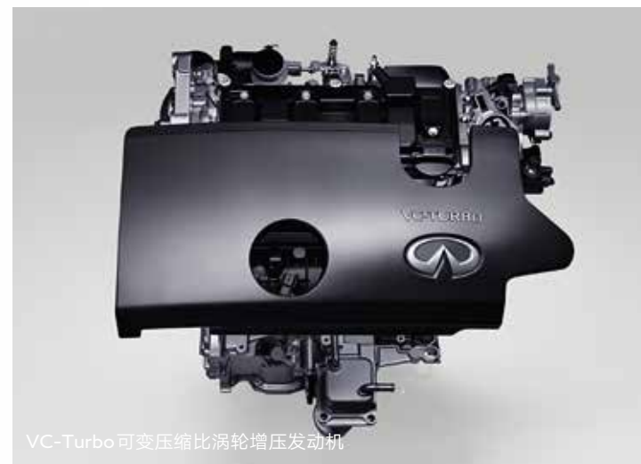
VC-Turbo可变压缩比涡轮增压发动机