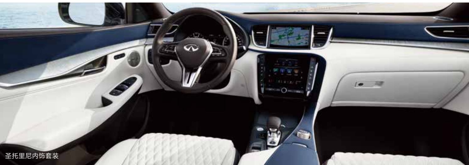
圣托里尼内饰套装